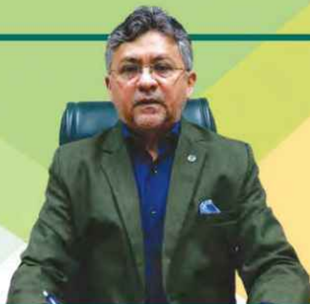
Jesus de Nazareno Magalhães de Sena Superintendente - Superintendência de Agricultura e Pecuária do Estado do Pará - MAPA

Considerando a capilaridade determinante que o Sistema Faepa/Senar/Sindicatos/Núcleos/Fundepec detém, combinada a diversificada aptidão agropecuária dos municípios que constituem o estado do Pará, e, ainda a necessidade do alcance dos anseios do Produtor Rural em apresentar as suas habilidades de produção e alcançar a evolução de mercado num vislumbre de melhorias, interação, e troca de conhecimento, no sentido da valorização do trabalho no campo e a relação direta que este efeito tem na vida nas cidades, entendemos que o Calendário de Eventos Agropecuários 2024 – Circuitos Dos Eventos do Agronegócio Do Pará é o instrumento norteador de tudo o que acontece na agropecuária paraense, ou seja, a verdadeira e propulsora vitrine das boas