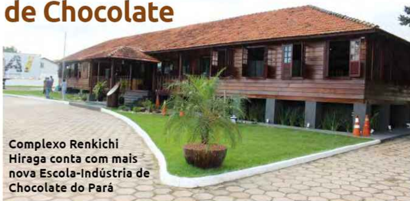
Complexo Renkichi Hiraga conta com mais nova Escola-Indústria de Chocolate do Pará

No dia 29 de fevereiro foi inaugurada a nova sede do Sindicato dos Produtores Rurais de Tomé-Açu e a Escola Indústria de Chocolate Senar, localizadas no Distrito de Quatro Bocas, em Tomé-Açu, na antiga escola de Ensino Fundamental de Ipitinga, patrimônio histórico da cidade, fundada pelos primeiros imigrantes japoneses chegados no Pará. O prédio, doado ao Sistema Faepa/Senar pela Prefeitura Municipal de Tomé-Açu, foi totalmente revitalizado, preservando-se a sua arquitetura original.