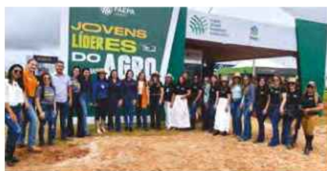
Evento Dinetec, em Dom Eliseu