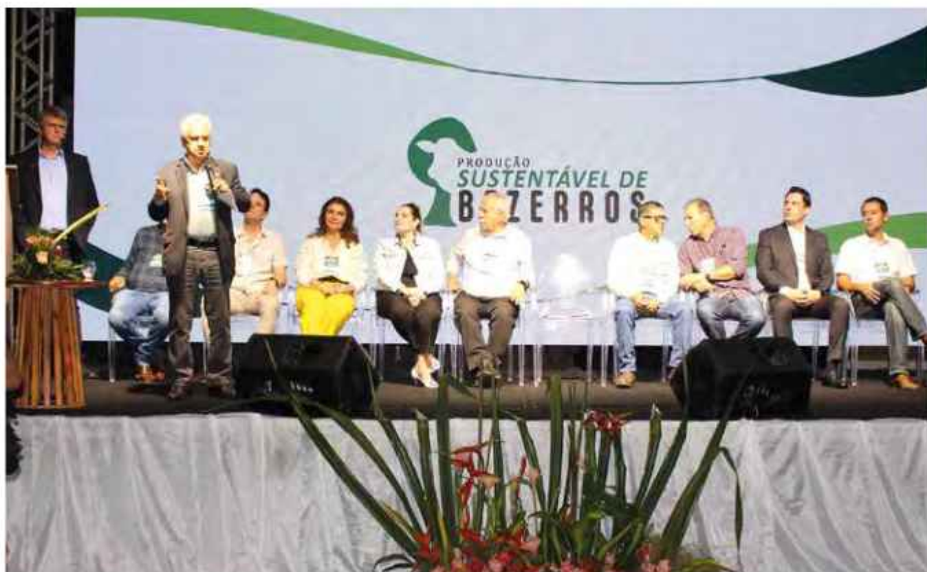
Lançamento do Programa Produção Sustentável de Bezerros, realizado no Sindicato dos Produtores Rurais, em Castanhal.